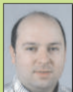
Vasco Miguel Oliveira Lavador Limpador Clímex